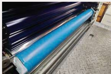
ローラーを回転するだけ！