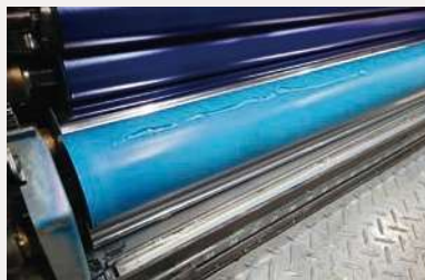
ローラーに直接塗布